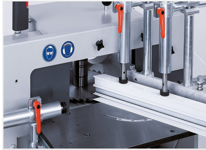
Frezarka do słupków AF 222/02