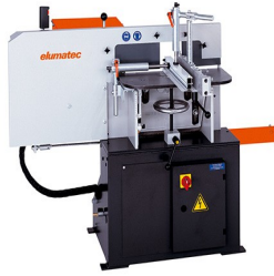
Frezarka do słupków AF 222/02