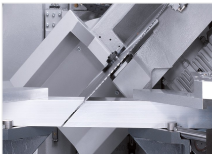
Centro di lavoro SBZ 631