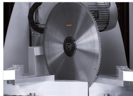
Centro di lavoro SBZ 631