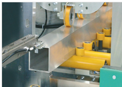
Centro di lavoro SBZ 631