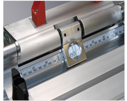
Sistema di battuta e misurazione MMS 200