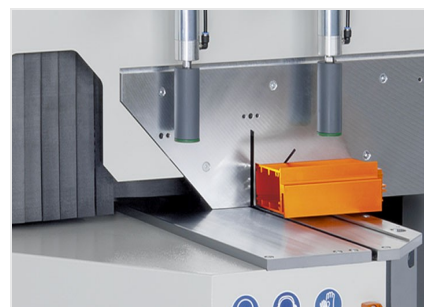
Troncatrice per tagli obliqui MGS 105