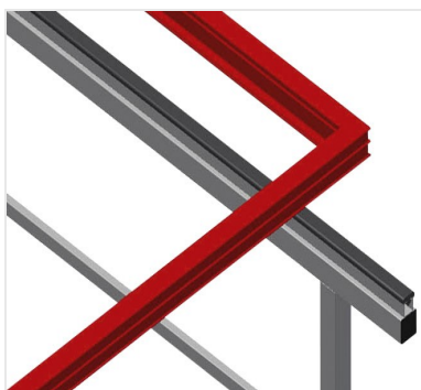
Superficie di appoggio