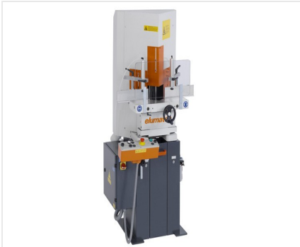
Sega per taglio di cunei e troncatrice a due lame KS 101/30