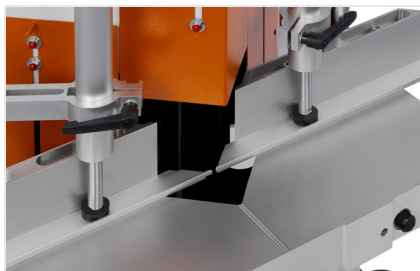
Sega per taglio di cunei e troncatrice a due lame KS 101/30