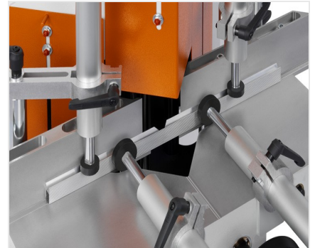
Sega per taglio di cunei e troncatrice a due lame KS 101/30