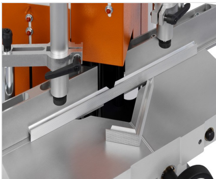
Sega per taglio di cunei e troncatrice a due lame KS 101/30