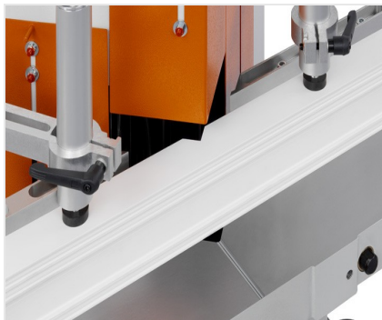
Sega per taglio di cunei e troncatrice a due lame KS 101/30