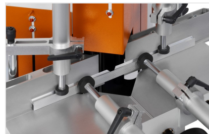
Sega per taglio di cunei e troncatrice a due lame KS 101/30