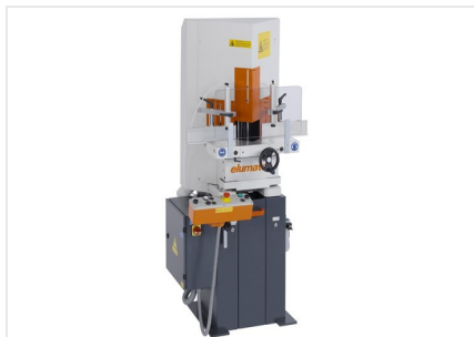
Sega per taglio di cunei e troncatrice a due lame KS 101/30