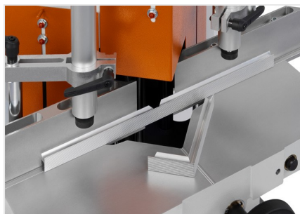
Sega per taglio di cunei e troncatrice a due lame KS 101/30