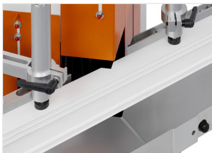
Sega per taglio di cunei e troncatrice a due lame KS 101/30