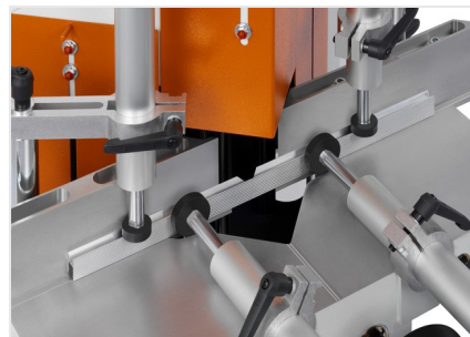
Sega per taglio di cunei e troncatrice a due lame KS 101/30