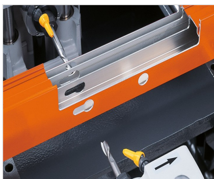
Pantografo a 2 mandrini KF 78/23