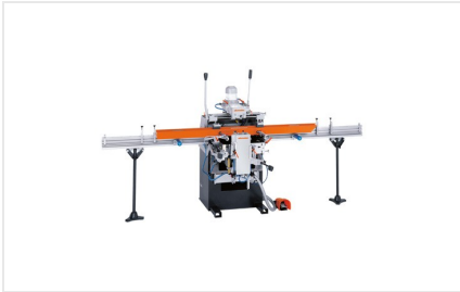
Pantografo a 3 mandrini KF 178/10