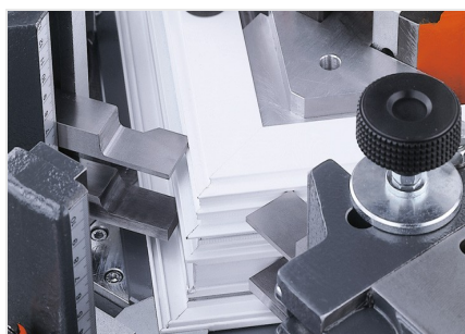
EP 124 Cianfrinatrice per angoli