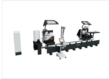
Troncatrice bilama DG 104 + E 590