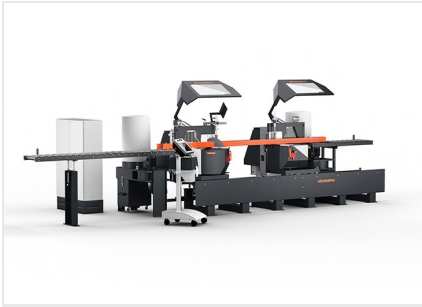
Troncatrice bilama DG 104