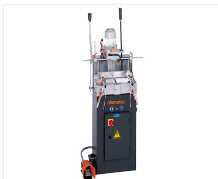
Pantografo a mandrino singolo AS 70/44