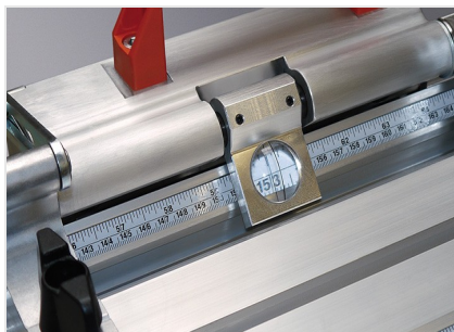
Sistema di battuta e misurazione AMS 200