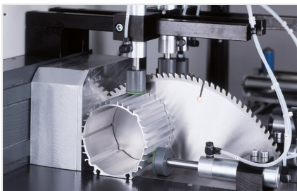
Scie automatique SA 142/37