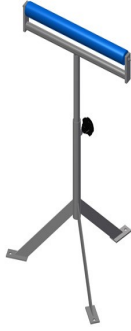
Support à galets MST 1000