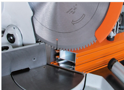
Scie à onglets MGS 73/33