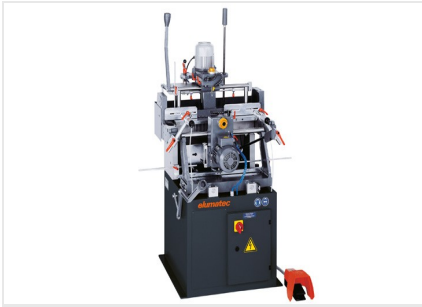
Fraiseuse à copier double- broches KF 78/23