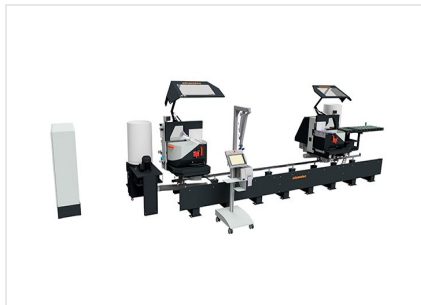
Diagramme de coupe DG 104