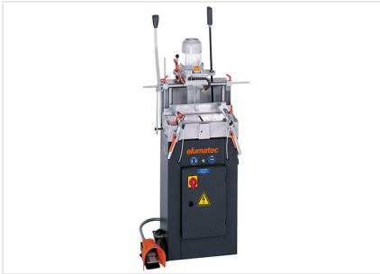
Fraiseuse à copier mono- broche AS 70/44