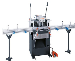
Fraiseuse à copier mono- broche AS 170/10