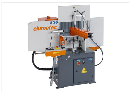
Fraiseuse en bout AF 223/01