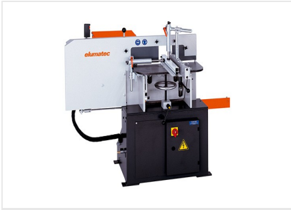
Fraiseuse en bout AF 222/02