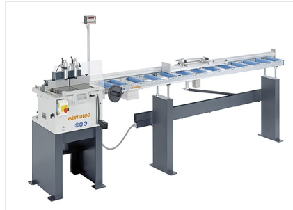
Sierra de mesa TS 161/21 + MMS 200