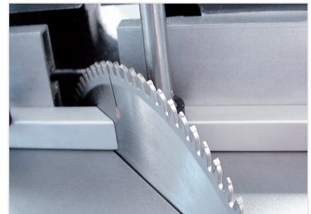
Sierra de mesa TS 161/21