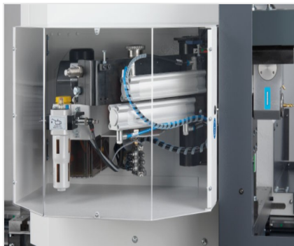
SBZ 140 Centro de mecanizado de barras