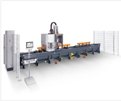
SBZ 140 Centro de mecanizado de barras