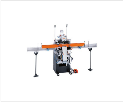
Copiadora fresadora triple KF 178/10