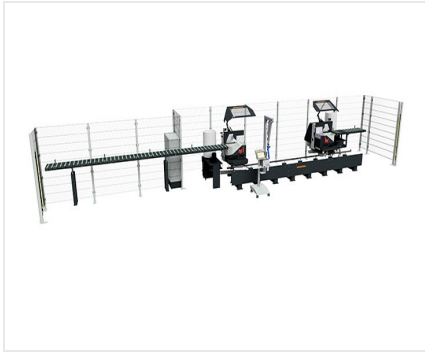
Tronzadora doble DG 104 DG 104 + accesorios especiales