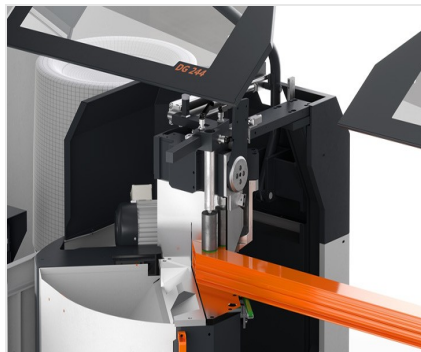
Tronzadora doble DG 104 Tope de medida corta