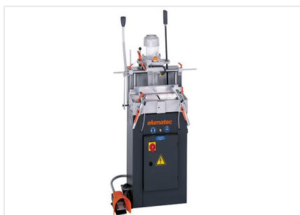
Copiadora fresadora simple AS 70/44