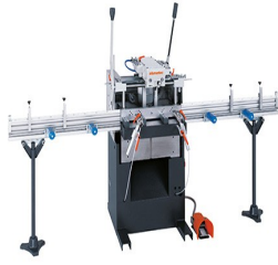
Copiadora fresadora simple AS 170/10