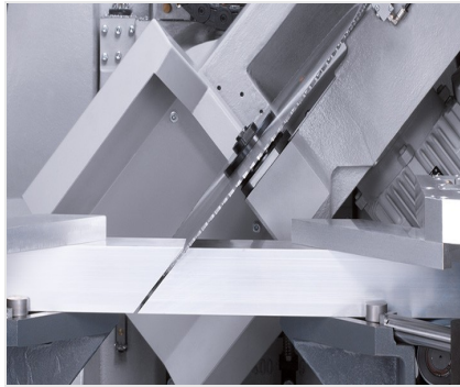
Stabbearbeitungszentrum SBZ 631