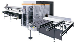
Stabbearbeitungszentrum SBZ 631