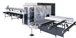
Stabbearbeitungszentrum SBZ 631