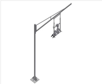
Gerätehalter G 3000 + Stahlsäule S 3000