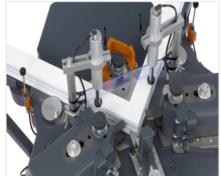
Eckverbindungspressen EP 124