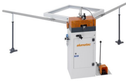
Eckverbindungspressen EP 120