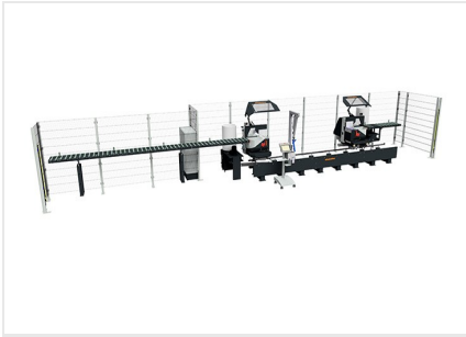
Doppelgehrungssäge DG 104 + Sonderzubehör