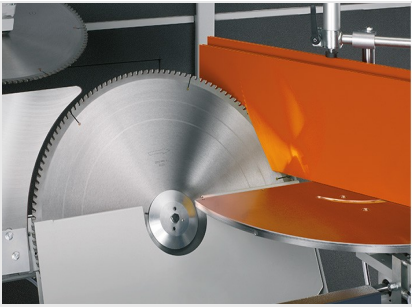
Auslinksäge AKS 134/64