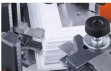
Lis pro spojování rohů EP 124