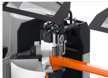
Dvoukotoučová pila DG 104