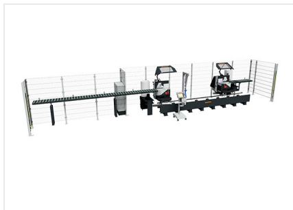
Dvoukotoučová pila DG 104 + speciální příslušenství