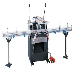
1vřetenová kopírovací fréza AS 170/10