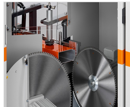
Vyřezávací pila AKS V-550