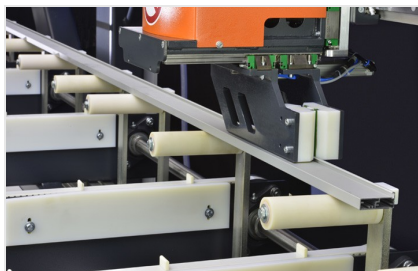
Centre de découpe SBZ 616/02