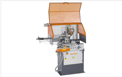
Scie automatique SA 73/36