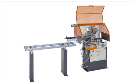
Scie automatique SA 73/36