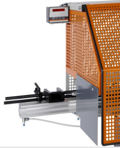
Scie automatique SA 73/36