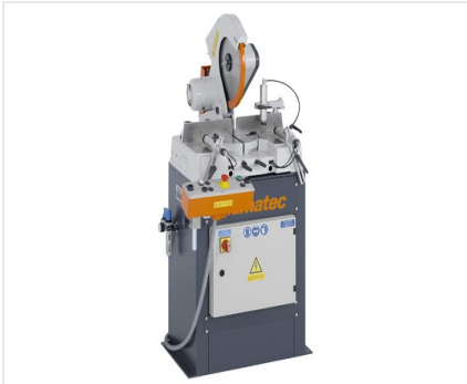
Scie à onglets MGS 73/33