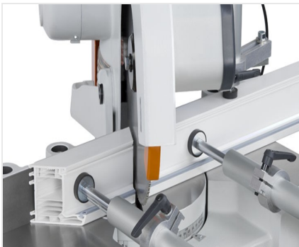
Scie à onglets MGS 73/33