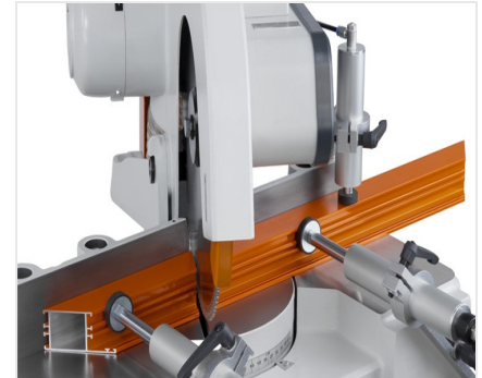
Scie à onglets MGS 73/33