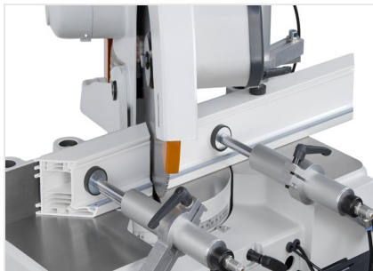
Scie à onglets MGS 73/33