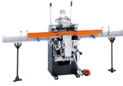
Fraiseuse à copier triple-broche KF 178/10