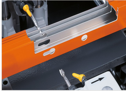
Fraiseuse à copier triple-broche KF 178/10