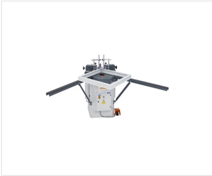
EP 124 Sertisseuse d'angle