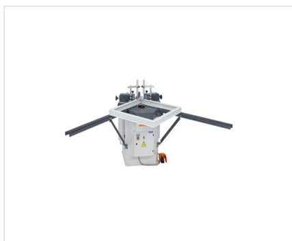
EP 124 Sertisseuse d'angle