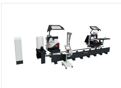
Diagramme de coupe DG 104