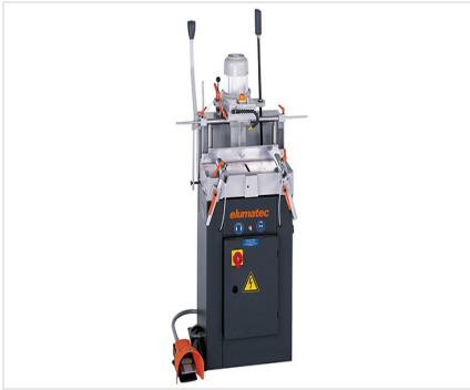
Fraiseuse à copier mono- broche AS 70/44