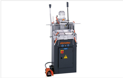
Fraiseuse à copier mono- broche AS 70/44