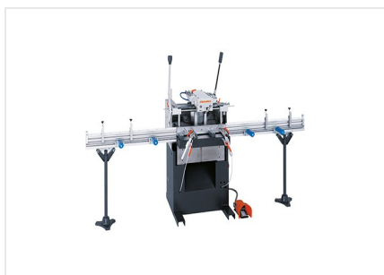
Fraiseuse à copier mono- broche AS 170/10