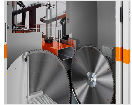
Scie à gruger AKS V-550