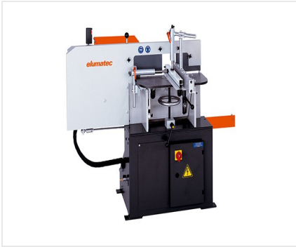
Fraiseuse en bout AF 222/02